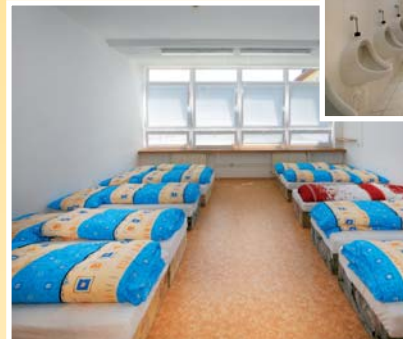
● osmilůžkový pokoj