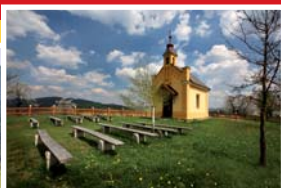
● kaple sv. Anny