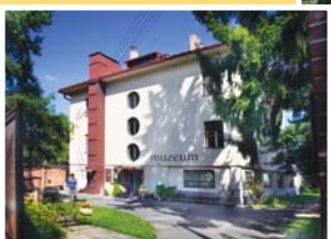
● městské muzeum