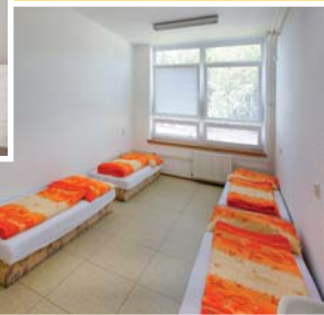
● čtyřlůžkový pokoj