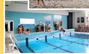
● plavecký bazén (vzd. 150 m)