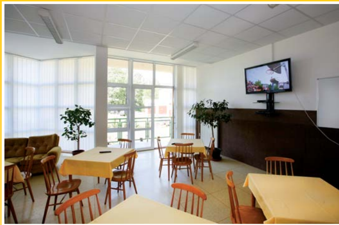
● společenská místnost

City tourist hostel offers double rooms to ten-bed rooms with hot and cold water. There is also a dayroom with a TV set and a satellite receiver. There is a wide choice of indoor and outdoor sports facilities in the hostel vicinity including an outdoor swimming pool with a beach volleyball court, an indoor swimming pool, a sports hall, tennis courts, a winter stadium, an outdoor playground and a football stadium with artificial grass.