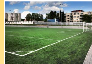
● fotbalový stadion (vzd. 50 m)