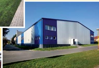
● hokejová hala (vzd. 150 m)