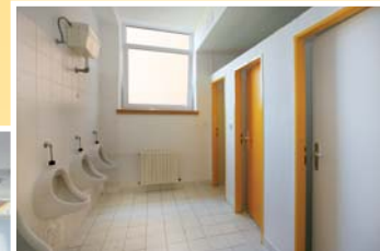
● sociální zařízení