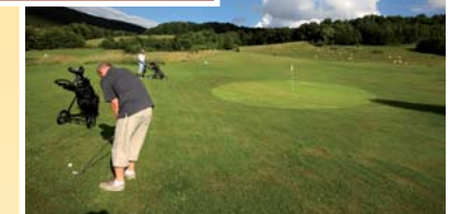
● golfové hřiště (vzd. 1200 m)