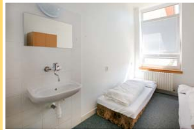
● dvoulůžkový pokoj