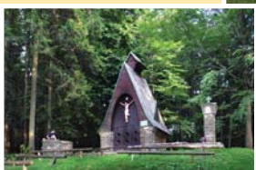
● hložecká kaple