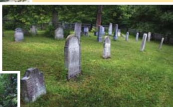
● židovský hřbitov