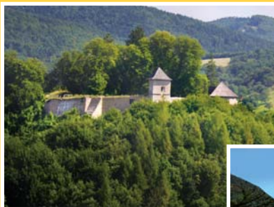
● hrad Brumov