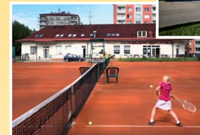
● tenisové kurty (vzd. 350 m)