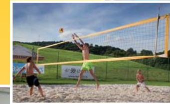
● hřiště na plážový volejbal (vzd. 100 m)