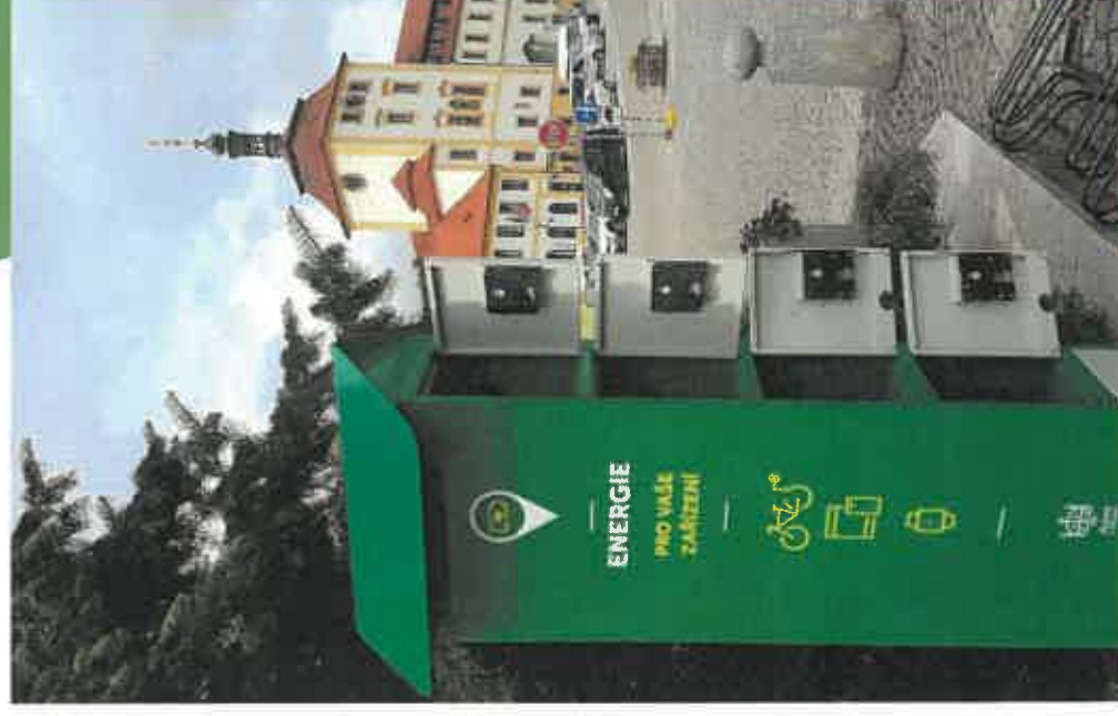
Instalace 9/2020 Masarykovo náměstí, město Hřivčice u Prahy stav k 7/2022

Výhodou je i možná reklamní plocha pro partnery, nebo turistická místa u Vás až 2,4 m 2 plochy k reklamě.