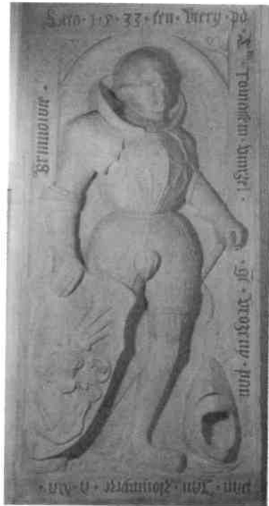
• Renesanční náhrobní kámen Jana z Lomnice (+1533), umístěný v jižní tzv. „bylnické“ kapli kostela