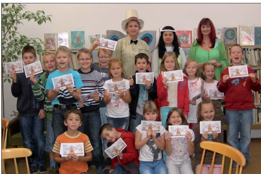
Týden knihoven v Brumově-Bylnici