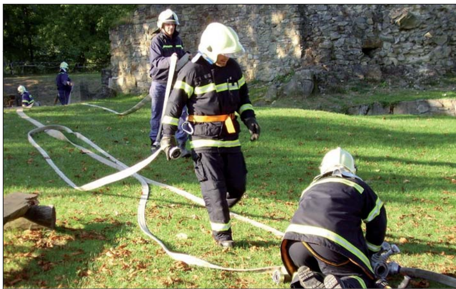
Hasiči zachraňují hrad