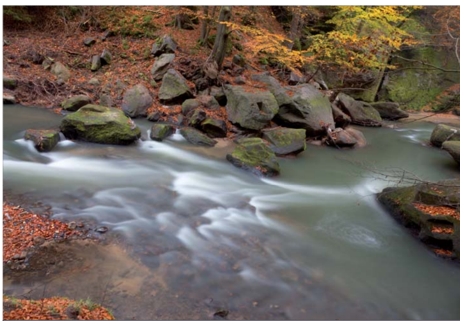
Krásy podzimu