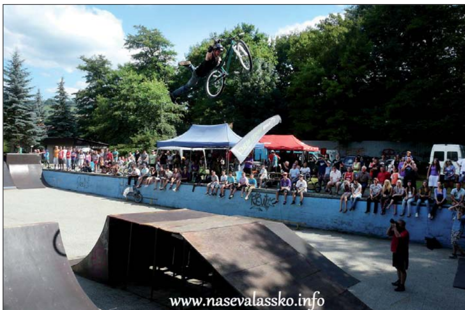
Jeden z mnoha náročných triků

Dne 16. 7. 2011 se v areálu bývalého koupaliště v Brumově konal 2. ročník charitativního závodu BMX & MTB Charity Jam II. Letošní výtěžek byl věnován na léčbu a zmírnění bolesti lidem trpící nemocí „motýlích křídel“. Veškerý finanční výtěžek z celé akce putoval organizaci Korunka Luhačovice, která tyto lidi sdružuje.