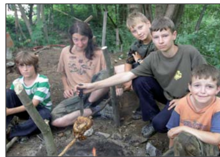
Skauti a vlčata

ní kůži si zkusily, že vydržet dva týdny bez počítače, televize a dalších vymožeností moderní doby a pobývat jen v přírodě není pro skauty žádný problém.