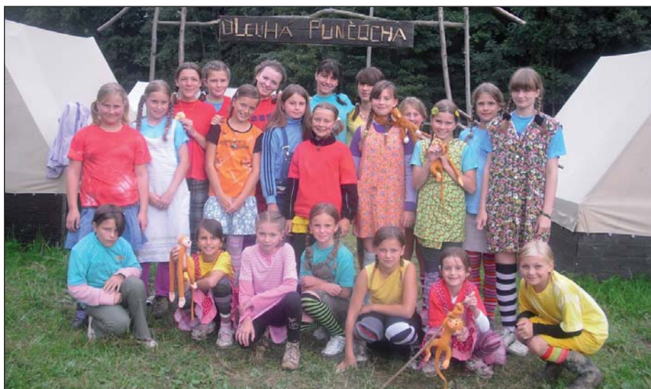
Tábor světlušek a skautek