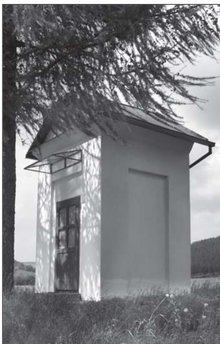
Kaple Panny Marie