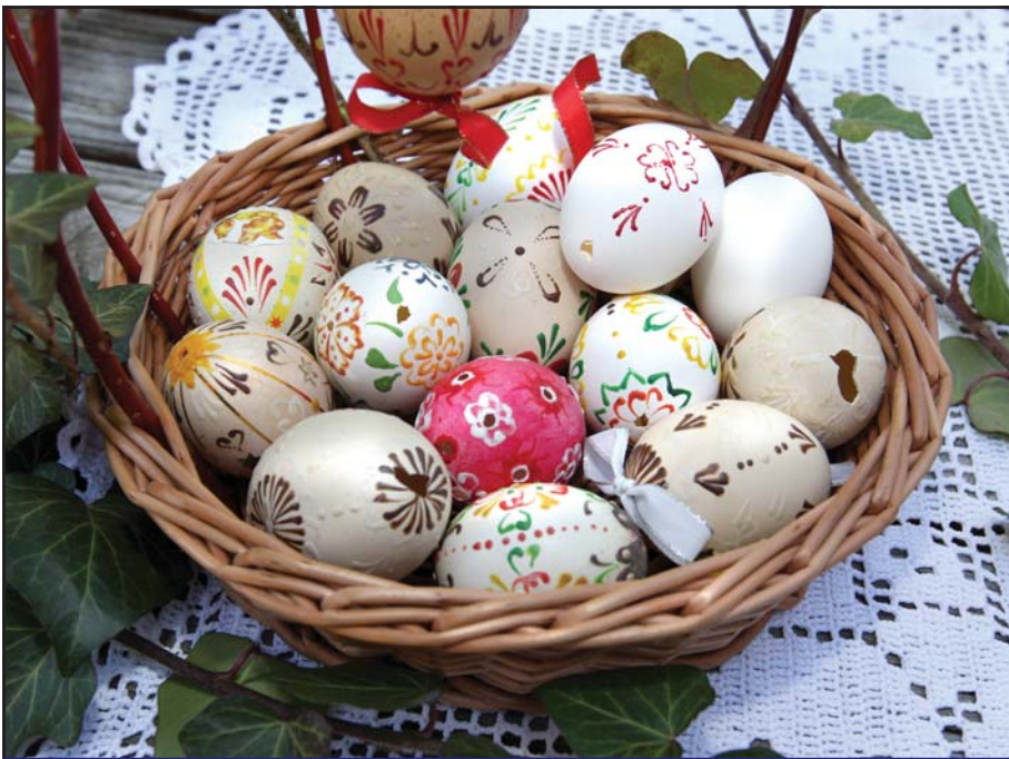
Jaro a velikonoční svátky jsou za dveřmi - přejeme jejich krásné prožití