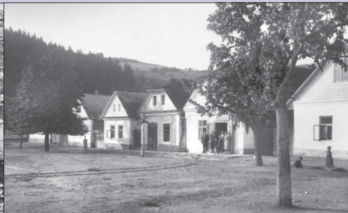
Brumov - náměstí v r. 1928 - p. Josef Ovesný