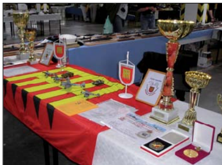
Trofeje plastikových modelářů