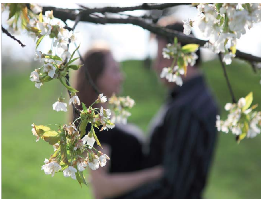
Je máj - lásky čas