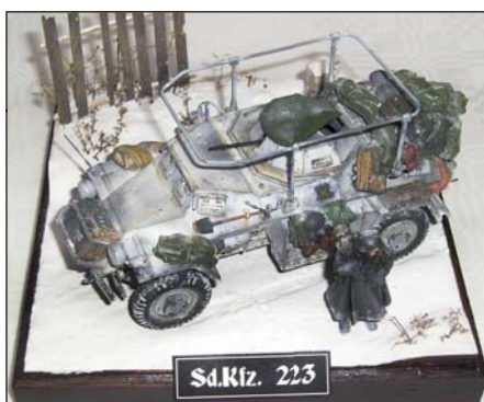
Sd. Kfz. 223 v měřítku 1:35

Memoriál Františka Louckého 8. ročník a Balejkův pohár 10. ročník Valašský klub plastikových modelářů v Brumově-Bylnici zve na výstavu a soutěž Memoriál Františka Louckého a Balejkův pohár 21. května 2011 v kulturním domě. Na výstavě bude přes 200 plastikových a papírových modelů letadel, bojové techniky a lodí. Soutěž bude určena pro všechny věkové kategorie - mladší a starší žáci, junioři a senioři. Bližší informace o soutěžních kategoriích naleznete na www.vkpm.webz.cz . Přineste i vy vaše modely, budeme se těšit na setkání s vámi.