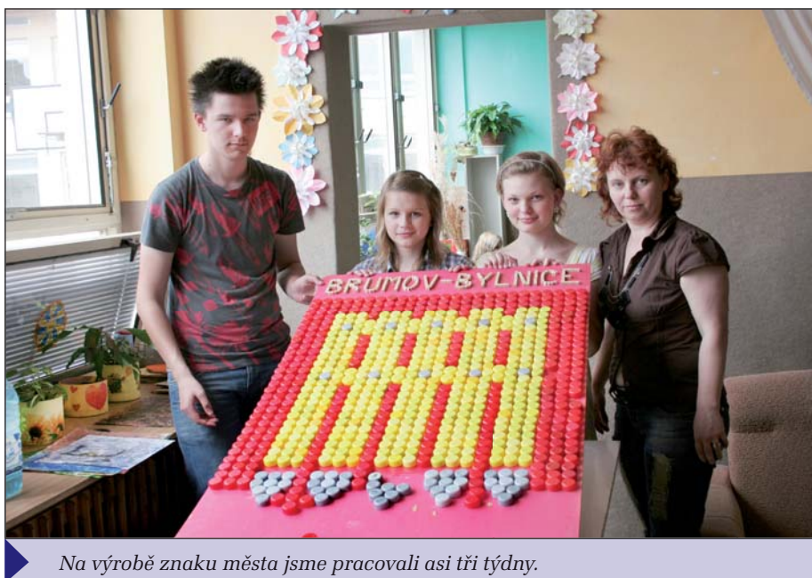
Na výrobě znaku města jsme pracovali asi tři týdny.