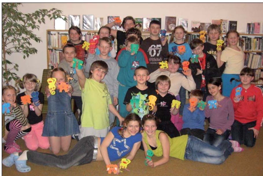
Děti s výrobky

jste si užili hodně legrace. Děti se dozvěděly spoustu nových a zajímavých věcí. Společně jsme se zapojili do čtení. Pro děti bylo připraveno i malé pohoštění. Paní Seifertová dětem i knihovnicím opět napekla výborné pečivo. Některé maminky poslaly malé pohoštění. Všichni jsme se shodli, že se již těšíme na příští rok.