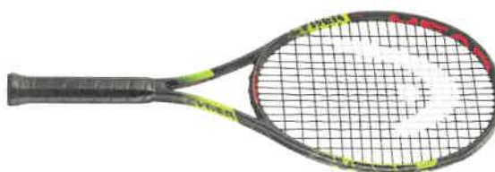
2 ks tenisových raket a míčky