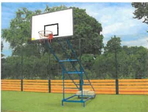
2 ks basketbalová konstrukce s deskou a košem