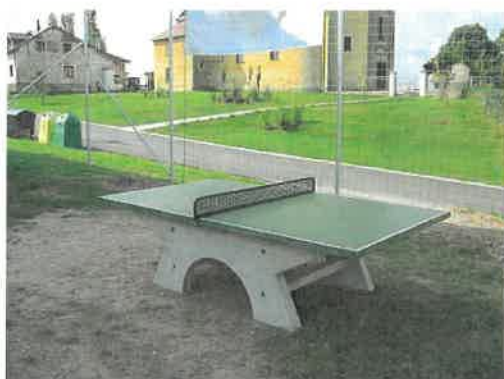
Betonový stůl na stolní tenis