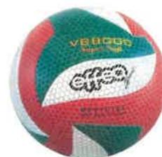
Nohejbalový a volejbalový míč