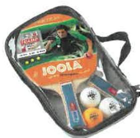
Pálky na stolní tenis